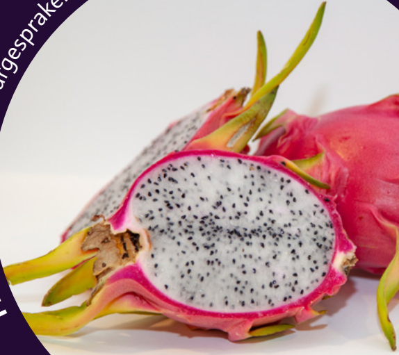
Pithaya/dragefrukt: Fargesprakende og mild.