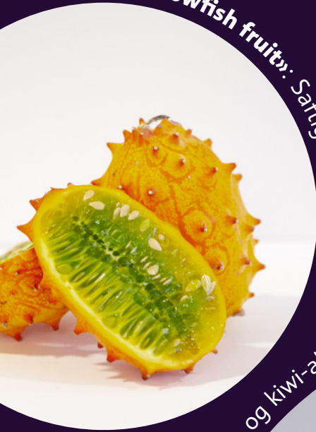
Kiwano/«Blowfish fruit»: Saftig og søt.